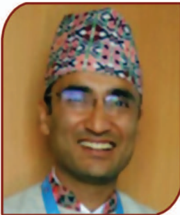
मुक्ति बोध न्यौपाने कम्पनी सचिव/नायब महाप्रबन्धक (वित्त)